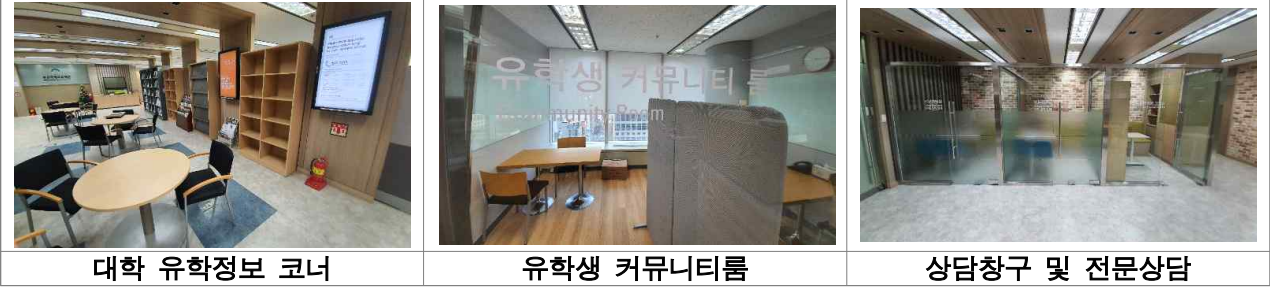
대학 유학정보 코너