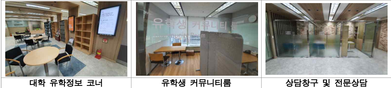
대학 유학정보 코너