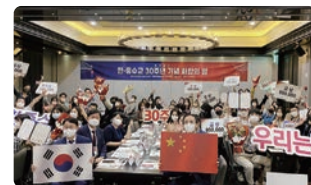
한중수교 30주년 기념행사