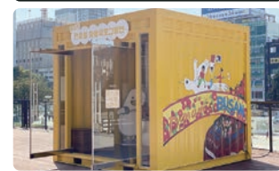
한-중·일 아동우호 그림전