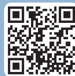
부산생활 가이드북 Life in Busan (안드로이드)