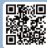
외국인 소식지 Busan Beat